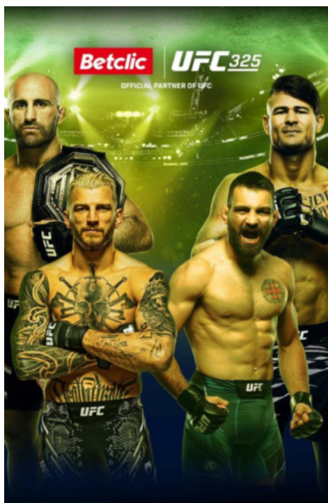
Ce partenariat permet à Betclik de pouvoir s'adosser à l'image des combattants stars de l'organisation tel que Benoît Saint-Denis.

Betclik met aussi en avant des figures fortes, adaptées à chaque pays. Cyril Gane et Benoît Saint-Denis en France. Charles Oliveira et Khamzat Chimaev en Pologne. Alex Pereira au Portugal. Cette capacité à localiser les récits, tout en s'appuyant sur la puissance globale de l'Ultimate Fighting Championship, constitue l'un des atouts majeurs de l'accord.