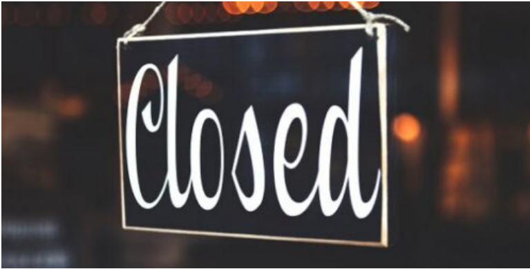
Le 1 janvier 2025, à 0h01, les portes des clubs de jeux parisiens doivent fermer leur porte. La faute à une séquence politique qui dépasse le simple cadre de l'industrie du jeu.

L'interruption est brutale dans ses effets, mais elle révèle surtout une fragilité institutionnelle. Le dispositif, globalement reconnu comme fonctionnel, se retrouve suspendu à un calendrier politique plus qu'à une évaluation de fond.