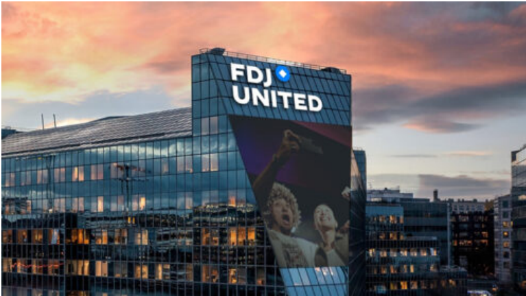
En mars, la France se dote d'un géant européen des jeux d'argent avec le lancement officiel de FDJ United, né de l'acquisition de Kindred Group par la Française des Jeux.

Cette évolution s'inscrit dans un cycle d'expansion marqué par l'acquisition de Premier Lotteries Ireland et la prise de contrôle de Kindred Group, positionnant FDJ United sur près de quinze marchés européens.