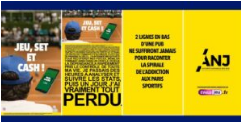
L'ANJ profite de Roland Garros pour sensibiliser les joueurs.

Cette éventualité inquiète les acteurs de la prévention, dont l'ANJ, qui anticipe un élargissement significatif de l'offre de jeux et, avec elle, une augmentation probable des comportements à risque. C'est pourquoi l'autorité veut frapper fort en amont, avant même que le marché n'évolue officiellement. Il s'agit d'alerter, de responsabiliser, mais aussi de rappeler aux opérateurs que leur devoir de vigilance ne saurait se limiter à des mentions légales ou des engagements de façade.