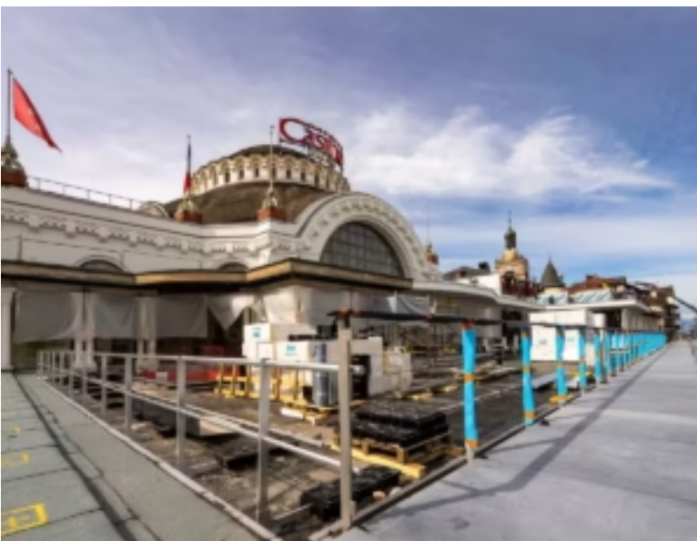
Le casino d'Evian a bénéficié d'une restauration achevée en 2024.